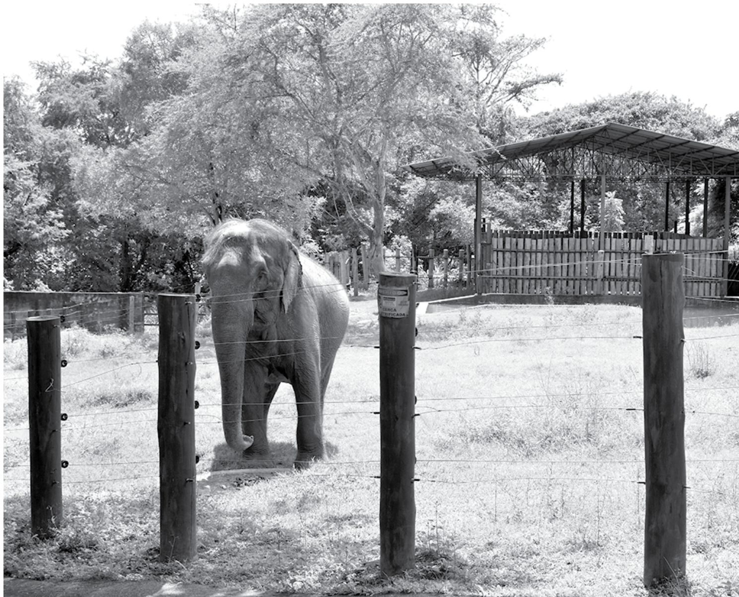
Lady está no Parque Arruda Câmara desde 2013, após ser resgatada de um circo. Laudos apontaram que a elefanta estava em espaço inadequado para sua saúde