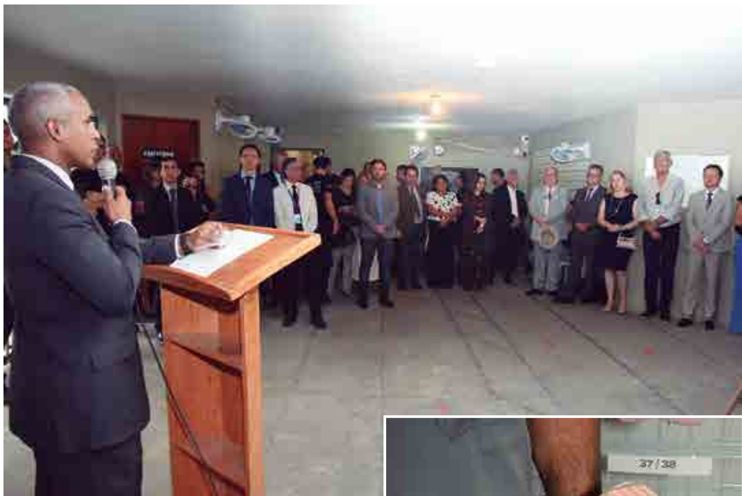
O secretário da Administração Penitenciária, tenente-coronel Sérgio Fonseca, ressaltou a importância da fábrica de calçados para gerar oportunidade, ocupando a mente e incentivando a ressocialização dos reeducandos

Além deste projeto de ressocialização estão para ser instalados: a fábrica de vassouras, na Penitenciária Média de Mangabeira; a fábrica de fraudas e absorven-