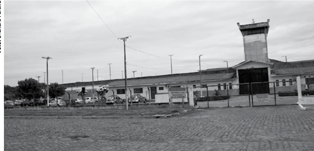
'Política Nacional de Atenção Integral à Saúde das Pessoas Privadas de Liberdade' é o tema do seminário