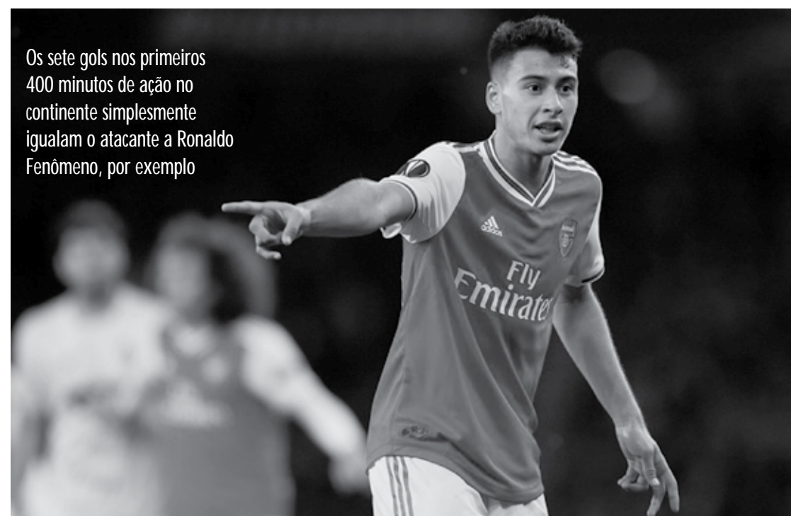
Os sete gols nos primeiros 400 minutos de ação no continente simplesmente igualam o atacante a Ronaldo Fenômeno, por exemplo

Martinelli, no entanto, atuou pouco no melhor nível encarado pelo Arsenal nesta temporada. Destaque em duas competições de menor importância ao clube londrino, nas quais Unai Emery não hesita em escalar reservas, o brasileiro soma apenas 45