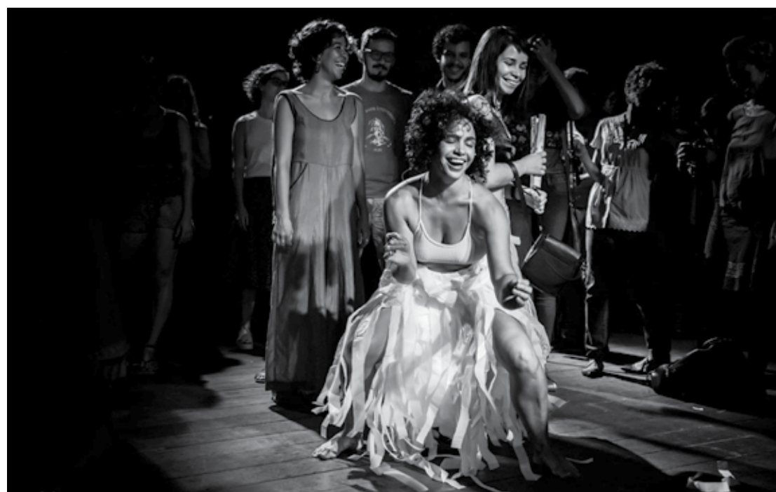
Baseado no carnaval, 'Ebulição' utiliza memórias, técnicas e ritmos extraídas de uma pesquisa sobre o frevo