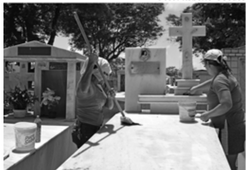
Serviços de zeladoria estão sendo intensificados