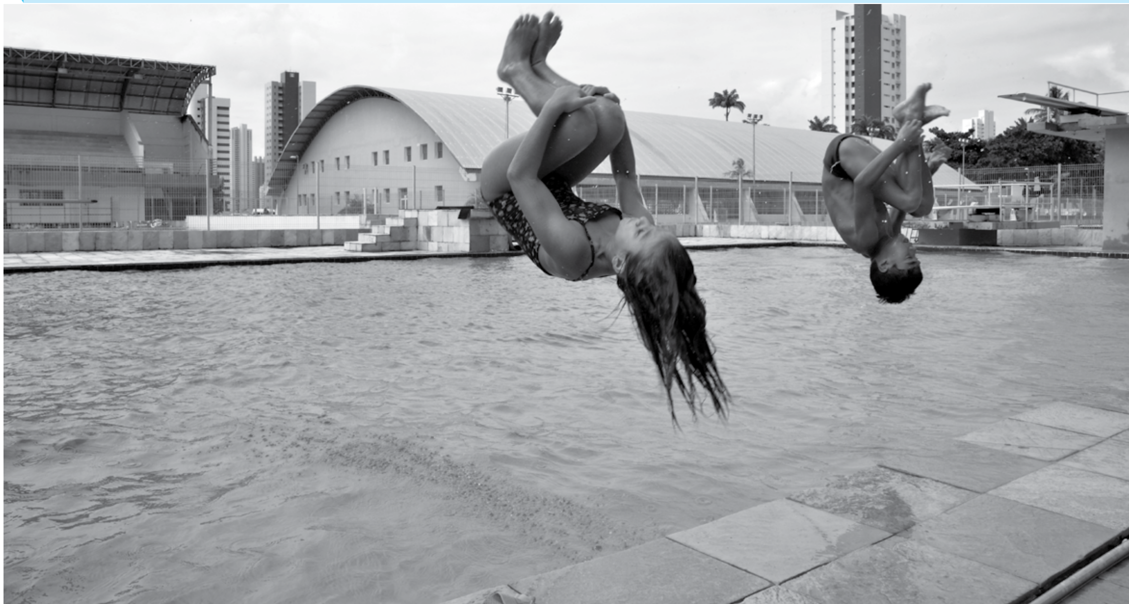
Após o Paraibano Absoluto de Natação em Campina Grande, a piscina de saltos ornamentais da Vila Olímpica Paraiba receberá o Campeonato Brasileiro Interclubes de Saltos Ornamentais na categoria júnior entre os dias 13 e 17 deste mês