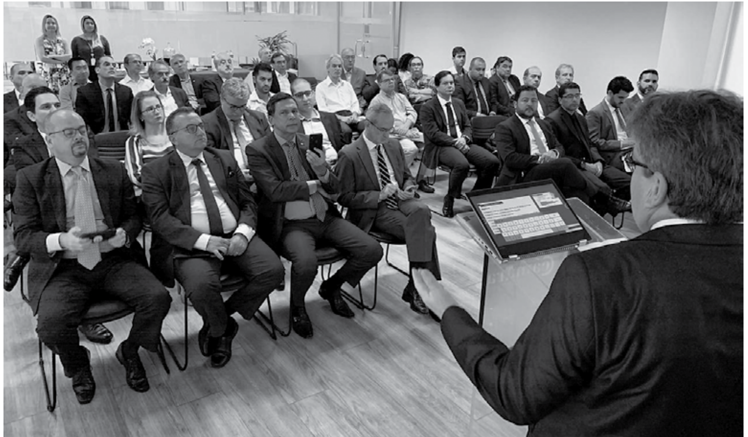
João Azevêdo destacou os potenciais turísticos e energéticos do Estado e detalhou o trabalho desenvolvido para manter a Paraíba no 1º lugar no ranking de competitividade do NE

O diretor executivo da Câmara Espanhola de Comércio no Brasil, Alejandro Gómez, agradeceu a participação do governador João Azevêdo e enalteceu o crescimento de investimentos nas áreas da infraestrutura, energia e turismo no Nordeste. “A Câmara Espanhola é uma das principais fontes provedoras de relacionamento entre o Brasil e a Espanha. Completamos 64 anos de atuação no país e o nosso objetivo é apoiar as 280 empresas associadas no desenvolvimento de novos negócios. O Brasil tem um grande potencial na pecuária e agricultura e vive um momento de reformas e abertura comercial e acreditamos que os investimentos virão”, frisou.