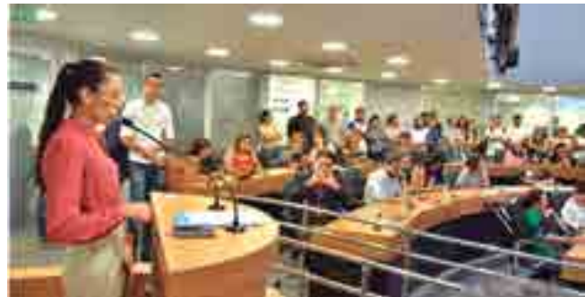
Economia paraibana vai receber um incremento de R$ 36 milhões

pasta, entre eles o Programa de Aquisição de Alimentos, que percorre municípios com a agricultura familiar, dando prioridade ao público quilombola, indígena e cigano.