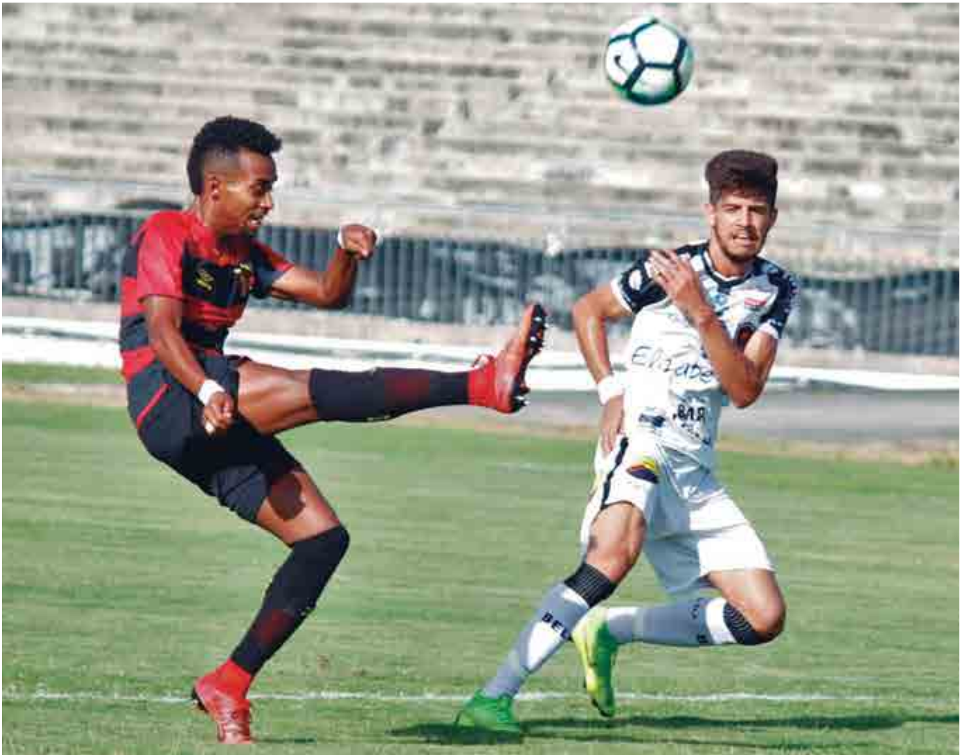
Na última terça-feira, o Botafogo perdeu de 1 a 0 para o Sport, no Almeidão. Antes já havia perdido de 2 a 1 para o Horizonte, no Ceará. Das quatro equipes do Grupo se classifica apenas uma